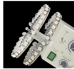
1.5mlマイクロチューブホルダー (※オプション)